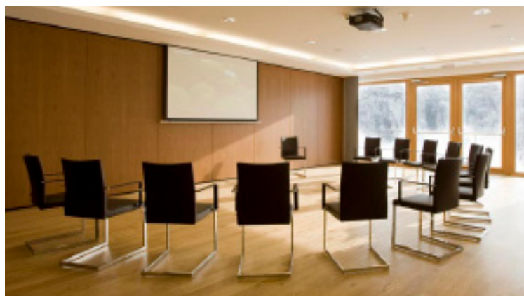
KONFERENZRÄUME 1,2 UND 3